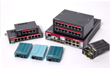
メディアコンバータ スwitchingハブ