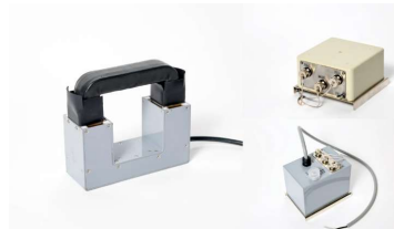
非接触電源 電力ケーブル用レイカブラ