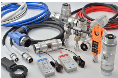
各種端末接続機材・無停電用機材