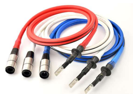
ワンタッチ接続端未付ケーブル