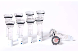
バッテリーインジケータ